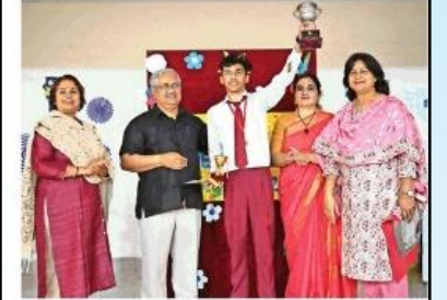
भारतीय प्रौद्योगिकी संस्थान रूड़की परिसर स्थित अनुश्रुति एकेडमी फॉर दी डेफ में वार्षिक प्रगति पत्र वितरण समारोह में ट्रॉफी दिखाते छात्र